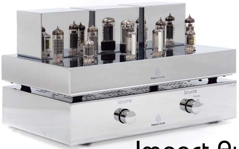
Impact Audio IA-01 & IA-02

EN VERDER: SONORE ANTARES CRESTRON HEGEL HD10 DAC XTZ SET VTL MB-125 & TL2.5 AUDIOGOEROES (DEEL 9)