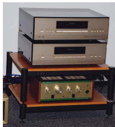
LEBEN & ACCUPHASE